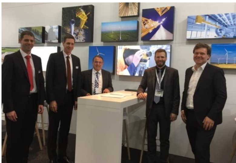
Bildunterschrift 1: Unterzeichnung des Vertrags über die Lieferung dreier reversibler Francispumpturbinen für den Naturstromspeicher Gaildorf.