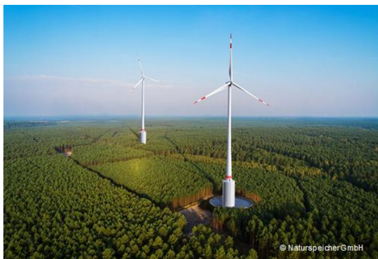
Bildunterschrift 2: Mit dem Naturstromspeicher entsteht aus einem Windenergiepark ein äußerst vielseitiges Kraftwerk.