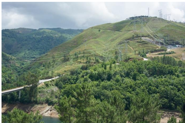
Bildunterschrift 1: Das Pumpspeicherkraftwerk befindet sich im Nordwesten Portugals und ist in einer unterirdischen Kaverne installiert.