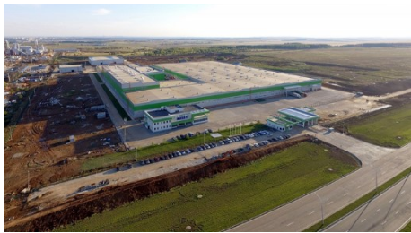
Bild 2: Werk von Hayat Kimya in der russischen Teilrepublik Tatarstan.