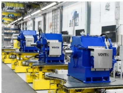
Voith TurboBelt TPXL Produktfamilie einschließlich der füllungsgesteuerten Turbokupplung TurboBelt 800 TPXL.