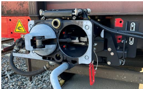
Die von Voith entwickelte E-Kupplung wird Standard im europäischen Schienengüterverkehr.